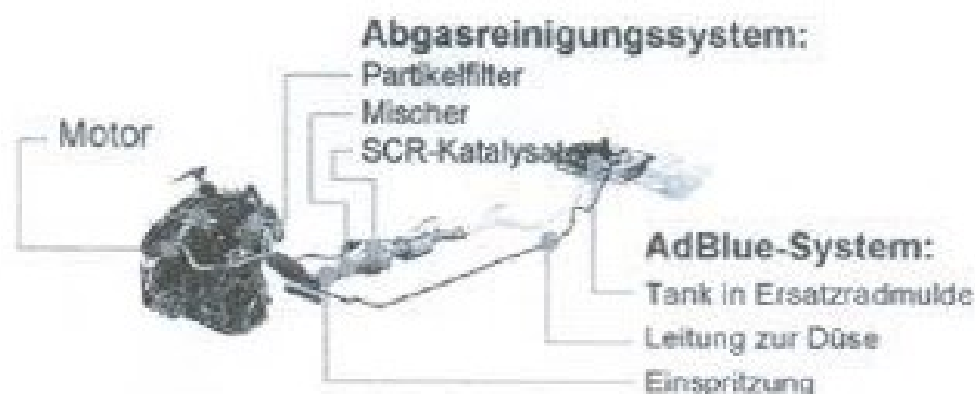
Elementy składowe systemu redukcji tlenków azotu NOx