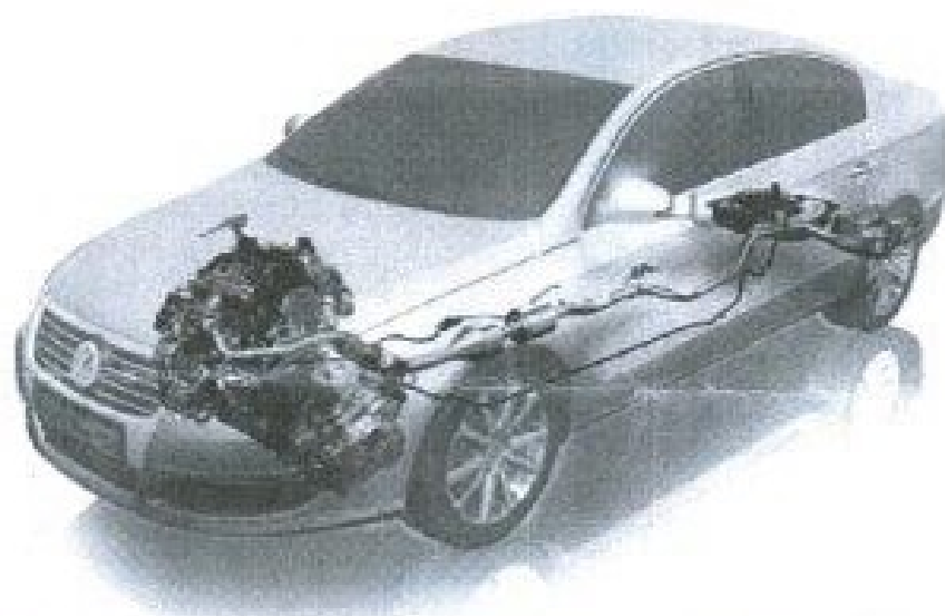
Rozmieszczenie elementów systemu redukującego tlenki azotu NOx w nadwoziu

Opisany sposób uzupełnienia wyposażenia samochodu pozwala na utrzymanie parametrów trakcyjno-eksploatacyjnych pojazdu (zużycie paliwa i moment obrotowy silnika) przy jednoczesnym spełnieniu norm dotyczących norm toksyczności spalin.